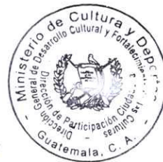
Firma y sello de la Autoridad que Evalúa los Servicios (según Clausula de contrato: Décima Primera)